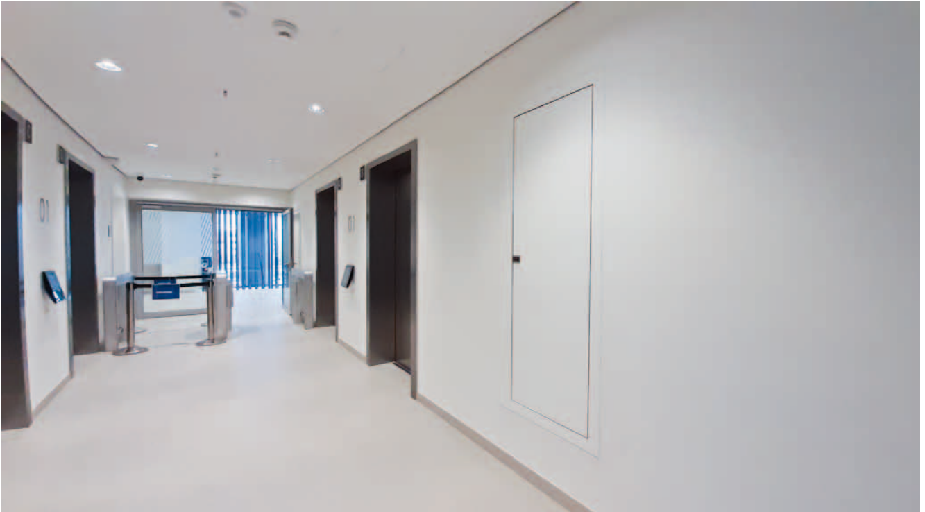
Unauffällige Entrauchungsklappe PRIODOOR ETX RDA

Damit in einem Brandfall eine zuverlässige Ableitung der Brandgase sichergestellt ist, wurden in diesem Projekt die Entrauchungsklappen in einer Außenhöhe 1900 mm und einer Außenbreite von 800 mm dimensioniert. Die in weißer Dekoroberfläche gewählte Optik passt ideal zu dem unauffälligen Erscheinungsbild des eleganten Gebäudes.