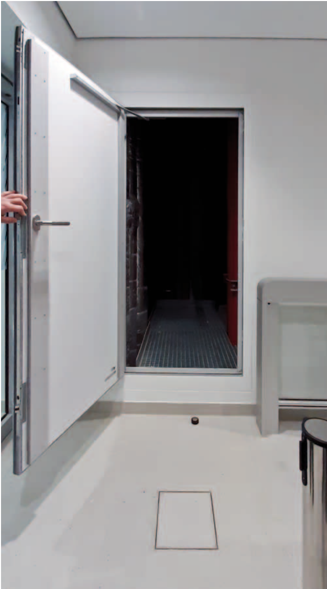
Geöffneter Revisionsabschluss PRIODOOR RTH